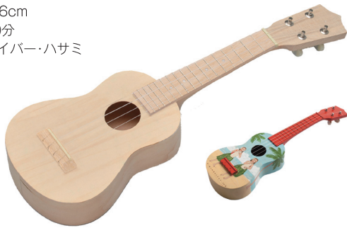
●着色例 TOKYO ILLUSTRATORS SOCIETY PRESENTS デコレレ 作者: 峰岸 達「マリナとルアナ」