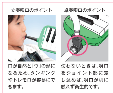
立奏吸口のポイント

取り回しの良いL字ジョイント。ホースが奏者側に向いているため、動作ロスが少なく、すぐに演奏できます。