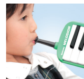
卓奏吸口のポイント