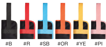
#B #R #SB #OR #YE #PI