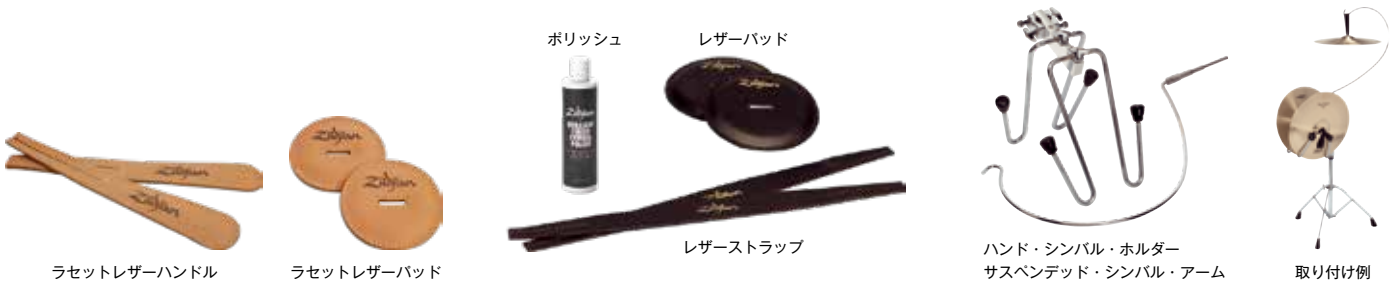
ラセットレザーハンドル