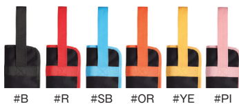
#B #R #SB #OR #YE #PI