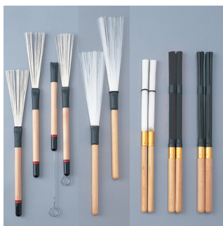
WBR-61 WBR-62 WBR-71 WBR-72 WBR-73 WBR-74