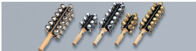
CB-25HL CB-13 CB-25 CB-13B CB-25B