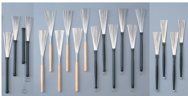
WBR-31 WBR-32 WBR-41 WBR-42 WBR-43 WBR-51 WBR-52 WBR-53 WBR-54 WBR-55