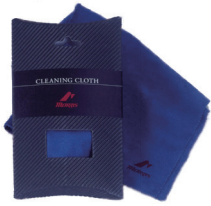
クリーニングクロス 価格:¥1,320 (税抜 ¥1,200)