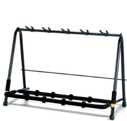
GS525B-N 価格:¥19,800 (税抜 ¥18,000)

楽器の表面を保護するために特別のラバーを採用し、特に楽器の塗装面を化学反応によるダメージから守ります。ラッカー塗装には対応していません。