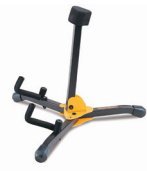
GS402BB 価格:¥5,390 (税抜 ¥4,900)