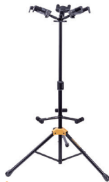
GS432B+ 価格:¥17,050 (税抜 ¥15,500)