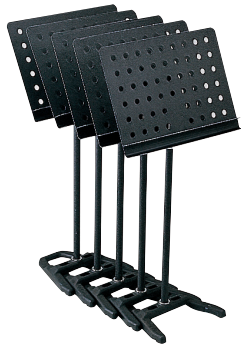
5台収納時の必要面積 800×500mm